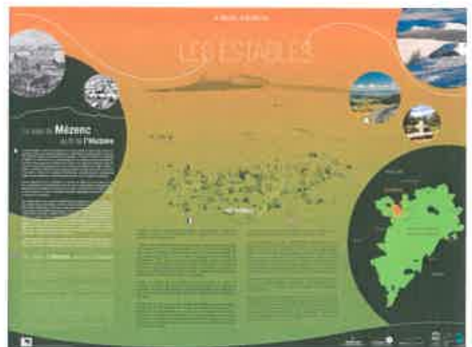
Panneau PNR des Etables

Des panneaux ont été réalisés par le parc régional des monts d'Ardèche pour les sept communes adhérentes. Nous devons choisir son lieu d'implantation. L'entretien du panneau est à la charge du parc pour 5 ans puis à la charge de la commune.