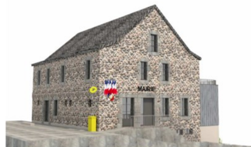
Rappel du rendu du projet final

On peut se rendre compte maintenant de l'emprise au sol et de la nouvelle configuration de la façade. Au départ, les travaux ont pu se dérouler normalement sous un automne plutôt clément. Ils ont ensuite été ralentis, début décembre, avec les chutes de neige et le gel. Mais la météo annoncée à l'heure où nous écrivons ces lignes, devrait permettre la pose des ouvertures pour assurer le hors d'eau/hors d'air du bâtiment et poursuivre les travaux intérieurs pendant la période hivernale.