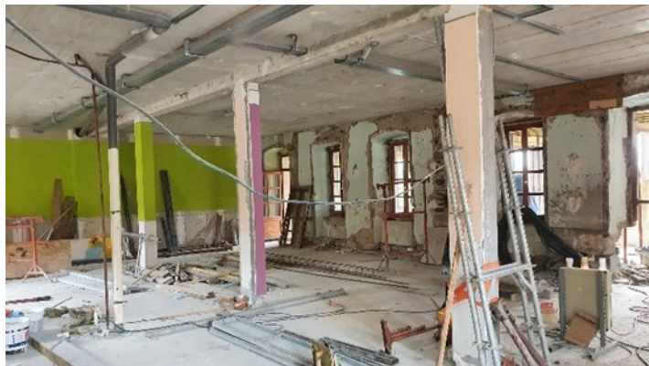
L'intérieur en cours de déconstruction, future implantation de la salle du conseil