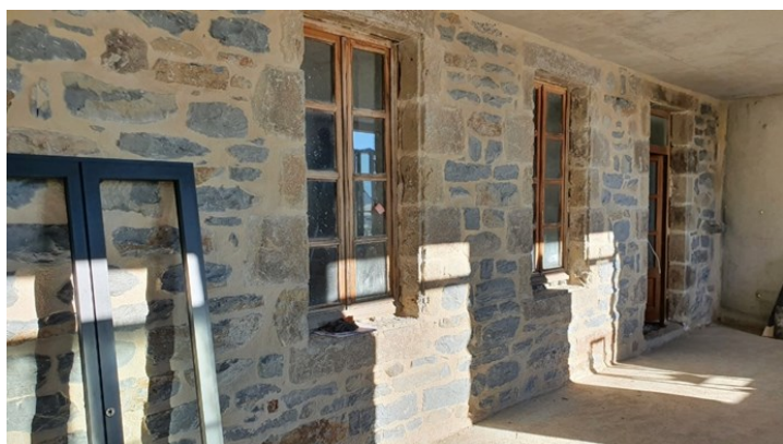
Mur intérieur en pierre jointée, future implantation du secrétariat de mairie et de l'agence postale