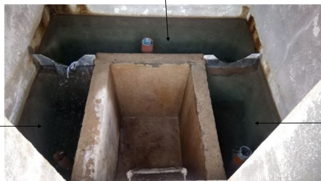
Eau qui alimente la ferme de Malosse