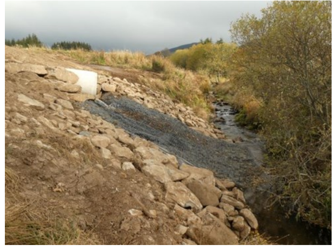
Matelas Réno installés au niveau de l'exutoire afin de limiter l'érosion en cas de crue