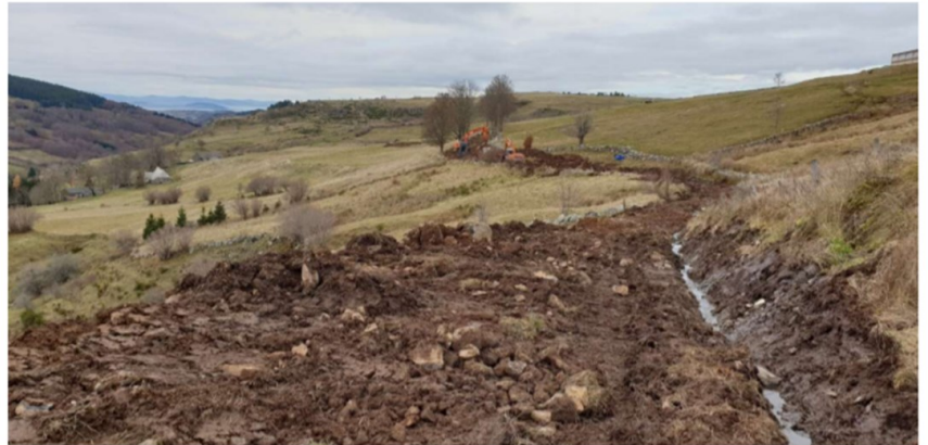
Chemin rural du Mas à Malosse

Conjointement aux travaux du réseau d'eau et d'assainissement de la Vacheresse, pour des raisons économiques, il apparaît intéressant d'en profiter pour enfouir les réseaux secs (électricité, éclairage et télécom). Un point a été fait par l'entreprise « Cegelec » en lien avec la maîtrise d'œuvre AB2R.