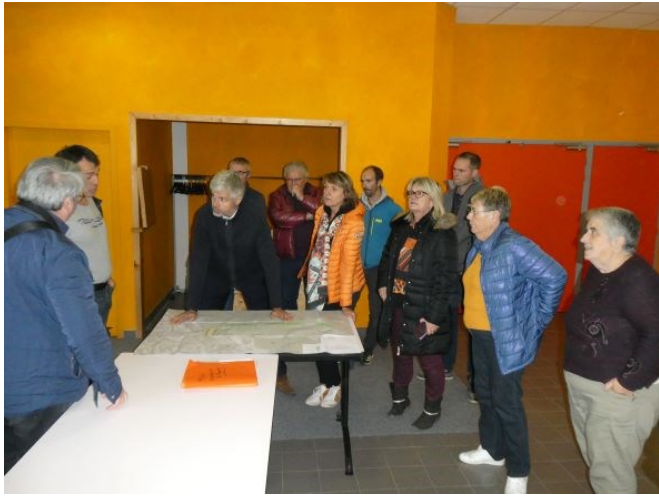
Visite des élus et prise de connaissance des travaux sur plan avant une visite sur le terrain