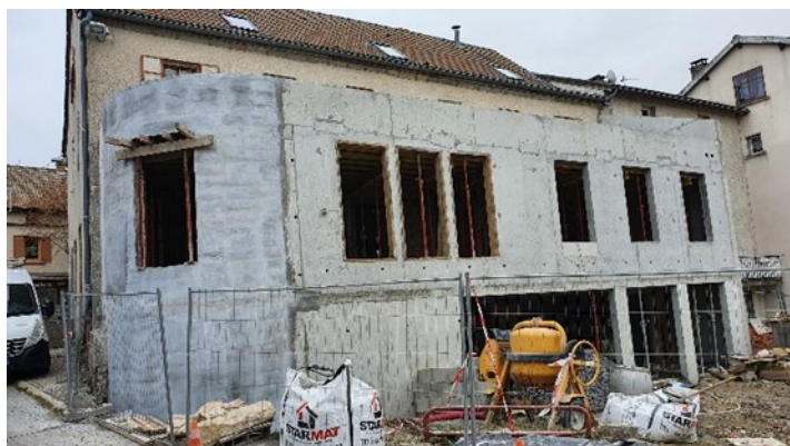
L'extension et la façade côté sud

Quelques photos pour se rendre compte de l'évolution et de l'étendu des travaux :