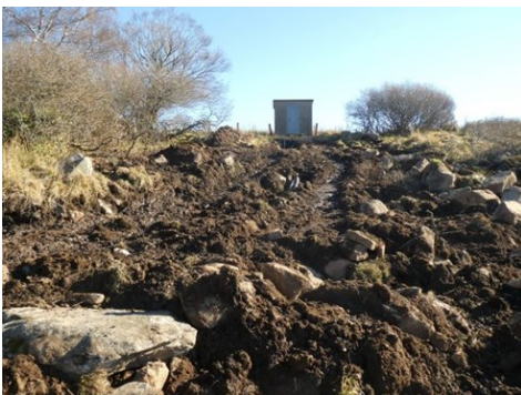
Eau qui alimente la Vacherresse