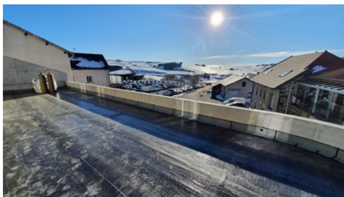
La terrasse des appartements du dernier étage