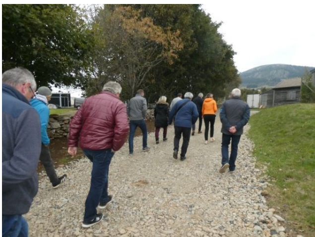
Chemin d'accès aux bâtiments agricoles des Gaec de la Bonne Fourche et du Mézenc, aménagé à l'emplacement de la canalisation, photo prise le 9 octobre lors de la visite des élus de la région.

La région nous a attribué une subvention relative à cette seconde tranche via le plan montagne. À ce titre, les élus de la région se sont rendus sur le chantier afin d'en prendre connaissance le 9 octobre.