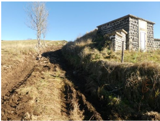
Le réservoir situé sur la route du Mas